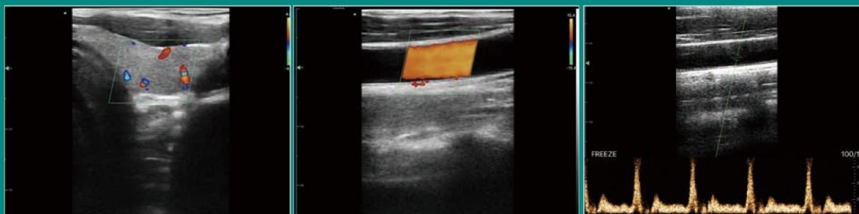
Thyroid C Mode